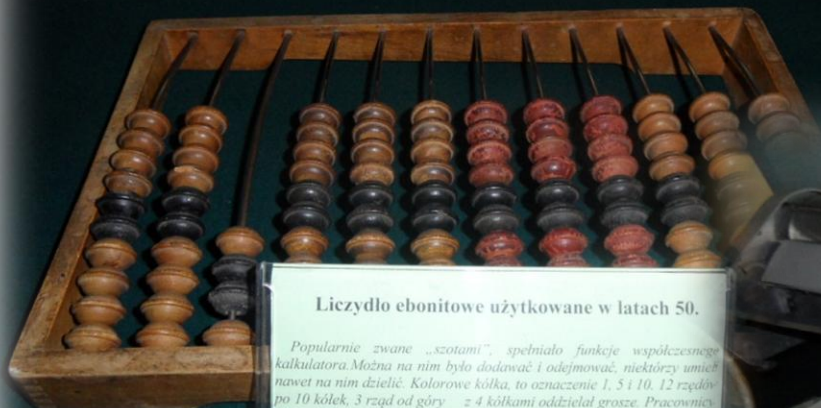
Liczydło ebonitowe użytkowane w latach 50.

Popularnie zwane „szotami”, spełniało funkcje współczesnego kalkulatora. Można na nim było dodawać i odejmować, niektórzy umieli nawet na nim dzielić. Kolorowe kółka, to oznaczenie 1, 5 i 10. 12 rzędów po 10 kółek, 3 rząd od góry = 4 kółkami oddzielał grosze. Pracownicy by szybko dodawać, smarowali szoty masłem.