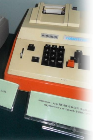
Sumator - typ ROBOTRON (kalkulator) użytkowany w latach 1980-1990